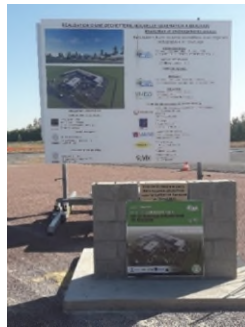
Phase 1 : pose de la 1 ère pierre