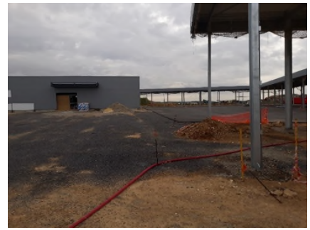
Phase 2 : chantier en cours