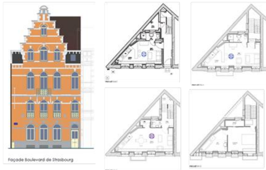
Façade Boulevard de Strasbourg

Restructuration et réhabilitation complète du logement en TCE