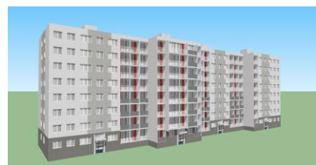
Illustration : ARCANA Architectes