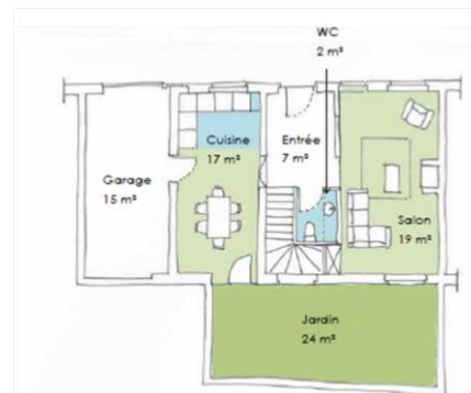
Plan RDC / SHAB = 45 m 2

Restructuration et réhabilitation complète du logement en TCE