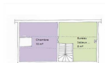
Plan combles / SHAB = 18 m 2

Illustrations : Atelier Debarge et Bellaigue Architectes