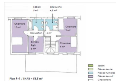
Plan R+1 / SHAB = 58.5 m 2